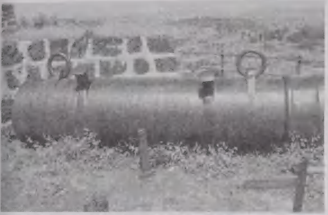
ಬೀದರ್‌ನಲ್ಲಿರುವ ದೊಡ್ಡ ತೋಪು

ಮಿಶ್ರಧಾತುಗಳ 'ಬಿದರಿ' ಕಲಾಕೃತಿಗಳು ತುಂಬ ಪ್ರಸಿದ್ಧವಾಗಿವೆ. ಮಧ್ಯಪ್ರಾಚ್ಯದ ಕಲಾಕಾರರನ್ನು ಕರೆಸಿಕೊಂಡು, ಬರೀದ್‌ಶಾಹಿಗಳು ತಮ್ಮ ನಾಡಿನವರೂ ಈ ಕಲೆಯಲ್ಲಿ ಮಿಗಿಲಾಗುವಂತೆ ನೋಡಿಕೊಂಡರು.